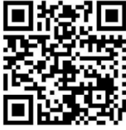
Burgfest Vorverkauf - Scan Me!

https://www.neustadt-glewe.de/Tourismus/Kulturelle-Highlights/Burgfest/